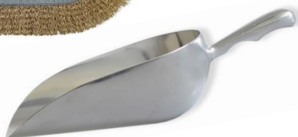
Pelle à fond rond