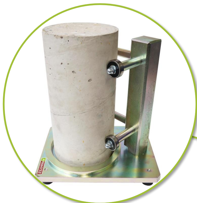
Surfaçage par roulements