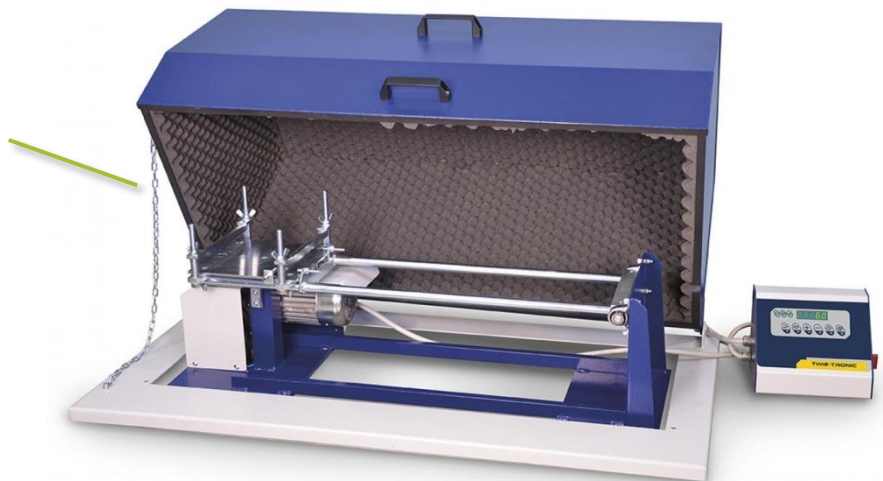
Réf. 20.0050.704 Caisson d'insonorisation