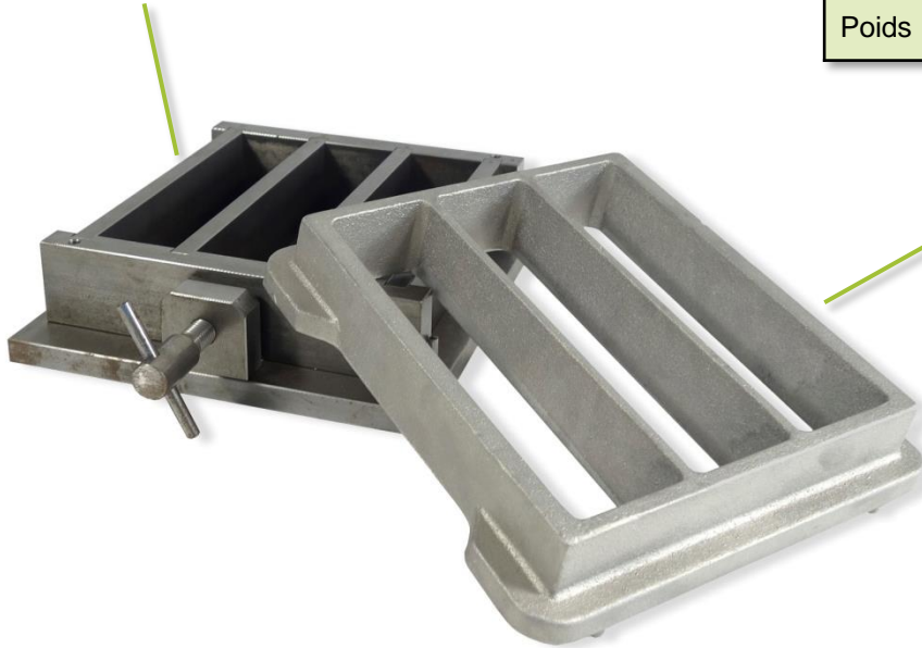
Réf. 20.0010 Moules triple