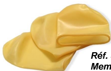
Réf. 55.0370.701 Membranes