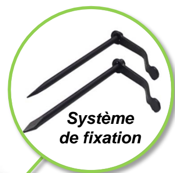
Système de fixation