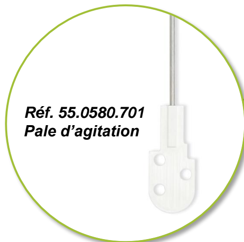
Réf. 55.0580.701 Pale d'agitation